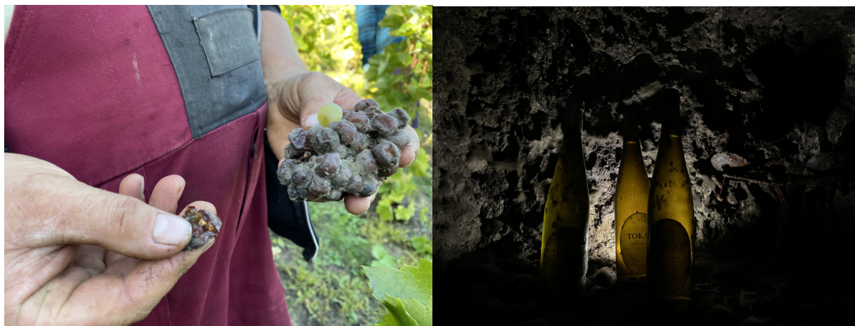
Figuras 5 e 6: 5- produtor de vinho me mostrando uvas “botritizadas” durante época de colheita. Tokaj, 10/10/2023; 6- vinhos “aszú” (nome dado as uvas e vinhos que passam pelo processo de botritização) em uma adega infestada pelo mofo Cladosporiumcellare , responsável por fazer um ambiente ideal para o envelhecimento dos vinhos de Tokaj. Tokaj, 07/10/2023.

influência na minha vida e formação em antropologia. A primeira foi com o início do que se tornou minha pesquisa de mestrado: uma investigação que conduzi em Tokaj, região vinícola localizada no Nordeste da Hungria, onde pude tentar entender o processo de feitura de vinhos Tokaji botritizados: vinhos que só podem ser feitos com uvas apodrecidas pelo fungo Botrytis Cinerea em seu estado “podridão nobre”.