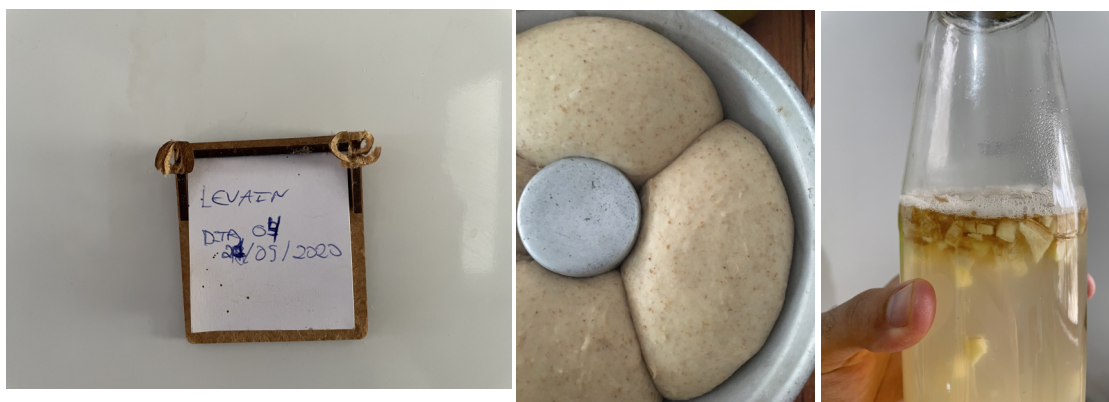
Figuras 2, 3 e 4: 2- foto que remete ao processo de feitura do fermento natural para pães, chamado de levain, no qual se faz uma mistura de farinha e água e mantém-se um processo de alimentação de leveduras por meio de mais farinha e água durante 7 dias. Na foto marco o dia 4 do processo. Teresina, 21/05/2020; 3- foto do pão feito com o levain pronto para ir ao forno. Teresina, 16/06/2020. 4- Foto do fermento de gengibre, que feito com um processo similar ao do levain, serve para a produção de refrigerantes naturais. Teresina, 20/07/2021.

Desisti porque não aguentava mais. Mesmo com as aulas enriquecedoras que tive durante o curso, com as conversas quase catárticas com colegas e amigas do programa, e com minha “virada probiótica” (Lorimer, 2020) experimentando com fermentações, eu estava doente. A tosse me deixava cansado; o negacionismo junto do trauma de quando fiquei doente por conta da COVID-19 me deixaram sequelas físicas e mentais; as condições em casa e na família, apesar de muito incentivo para que eu continuasse, não me eram favoráveis. Ficar sentado numa mesma posição durante várias horas por dia me fez desenvolver um problema na coluna que quase todo dinheiro que recebi com o Auxílio Emergencial e Monitoria Emergencial foi gasto com médicos e aulas de pilates. Não