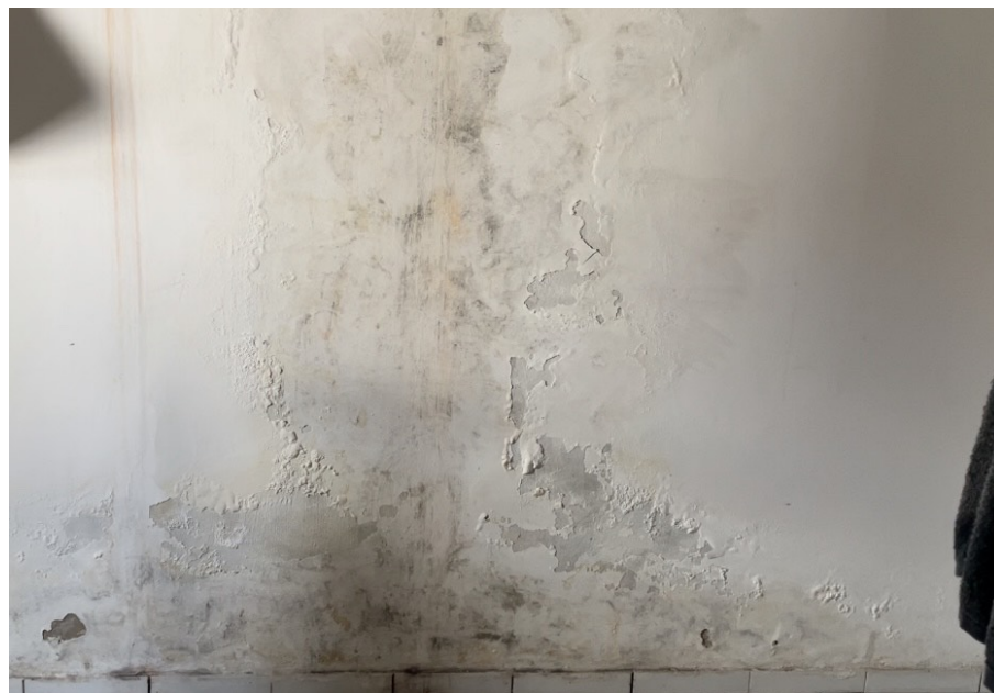
Figura1: Parede do meu quarto tomado por mofo. Teresina, 17/03/2021.