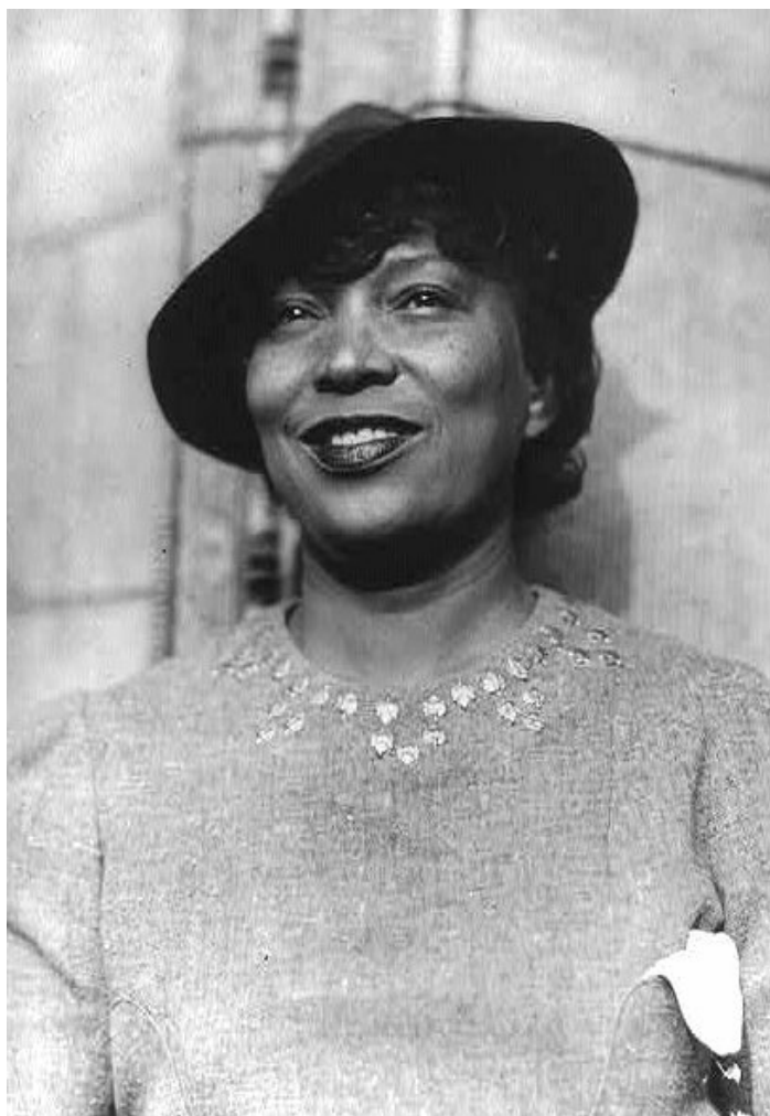
Figura 1. Retrato de ZoraNealeHurston

teatro e música negra como centrais. Outros nomes como Aaron Douglas e Louis Armstrong foram ativos nesta movimentação. Zora Hurston trabalhou em peças de teatro entre 1931 e 1934. Em 1934 obteve o título de PhD em Antropologia e também trabalhou como consultora para a produtora Paramount Pictures.