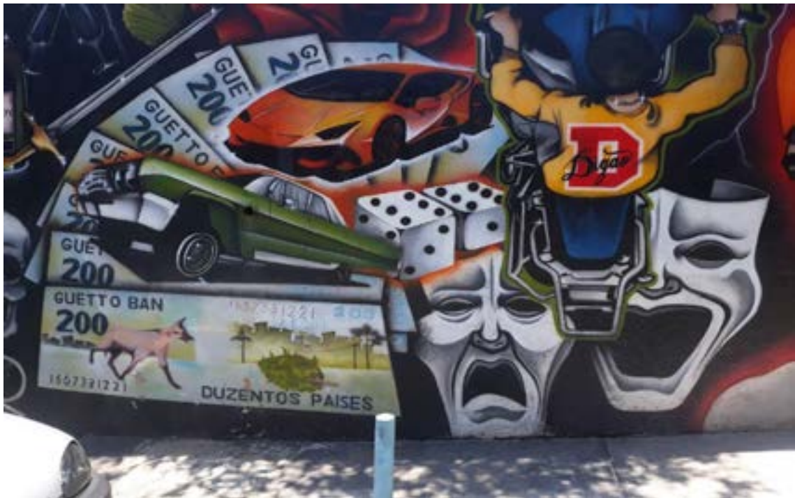
Figura 11 - Graffiti 05