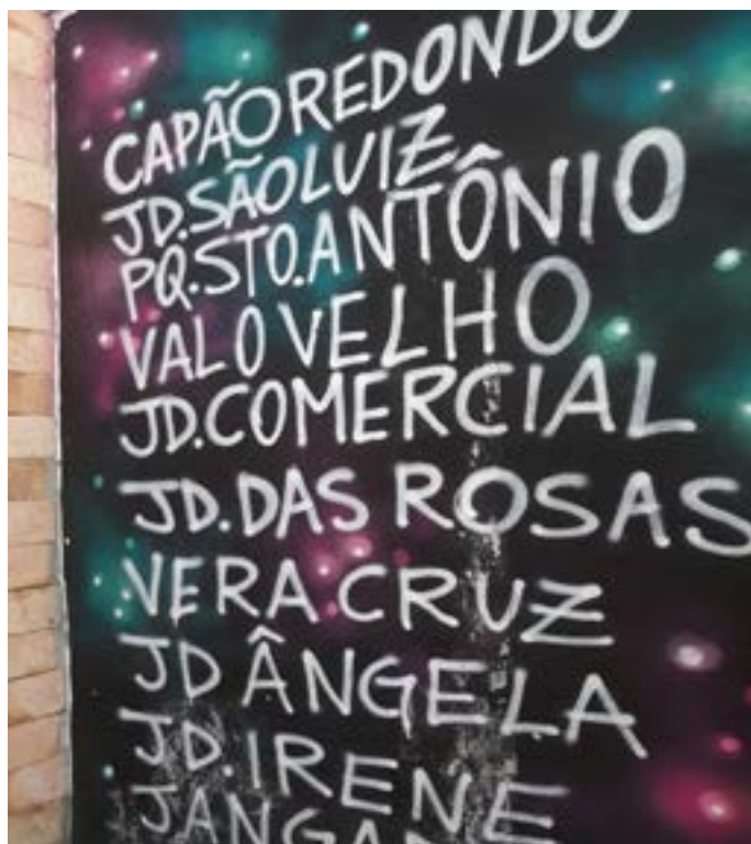
Figura 8 - “Quebradas”