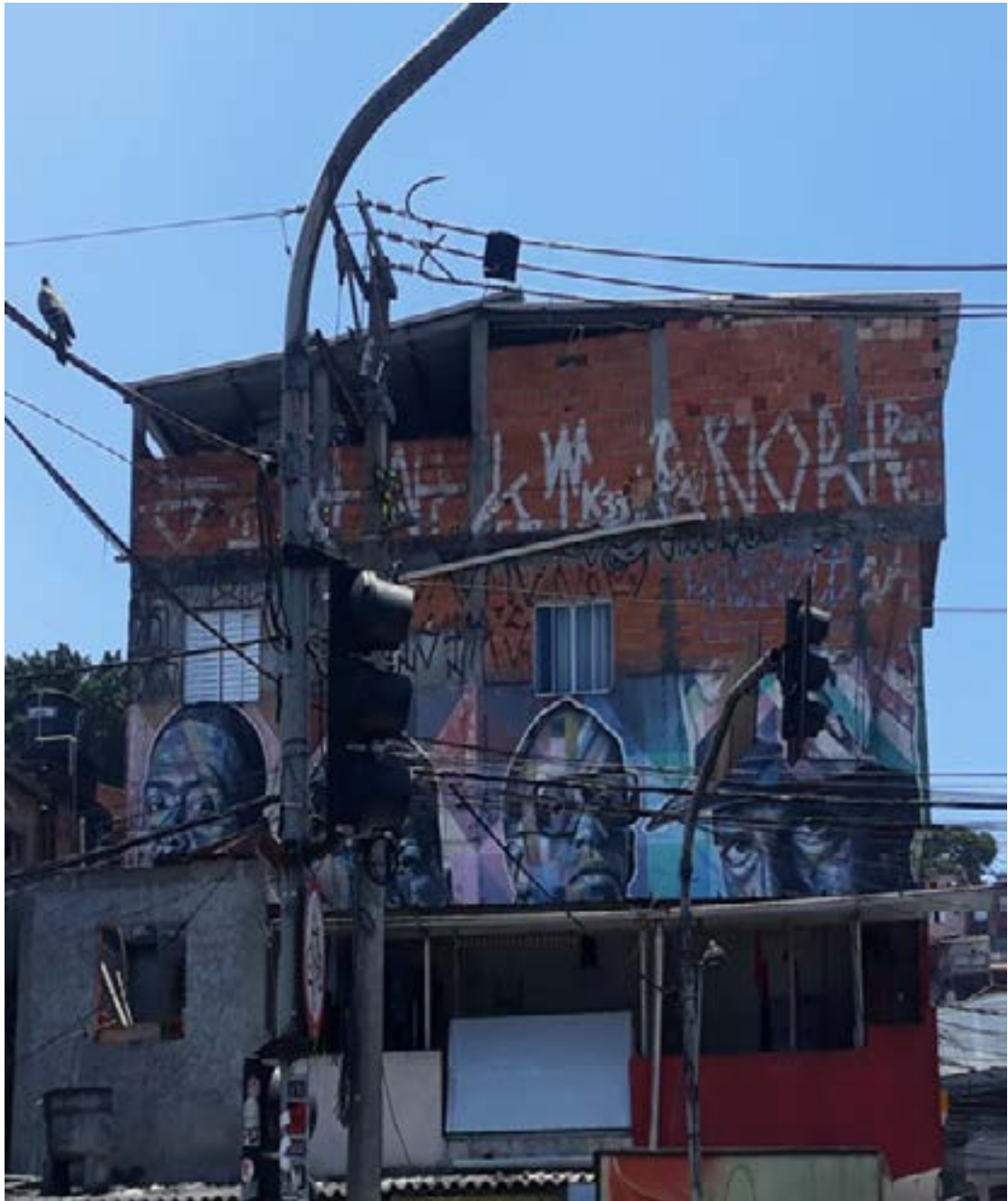
Figura 1 - Graffiti 01