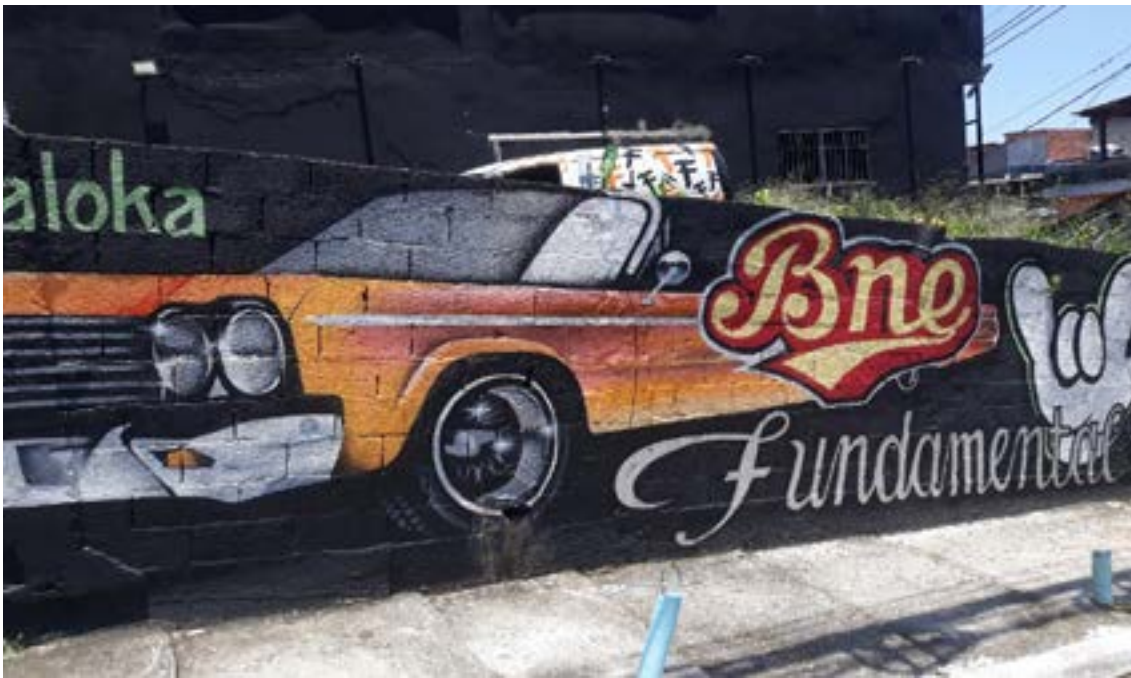
Figura 10 - Graffiti 04