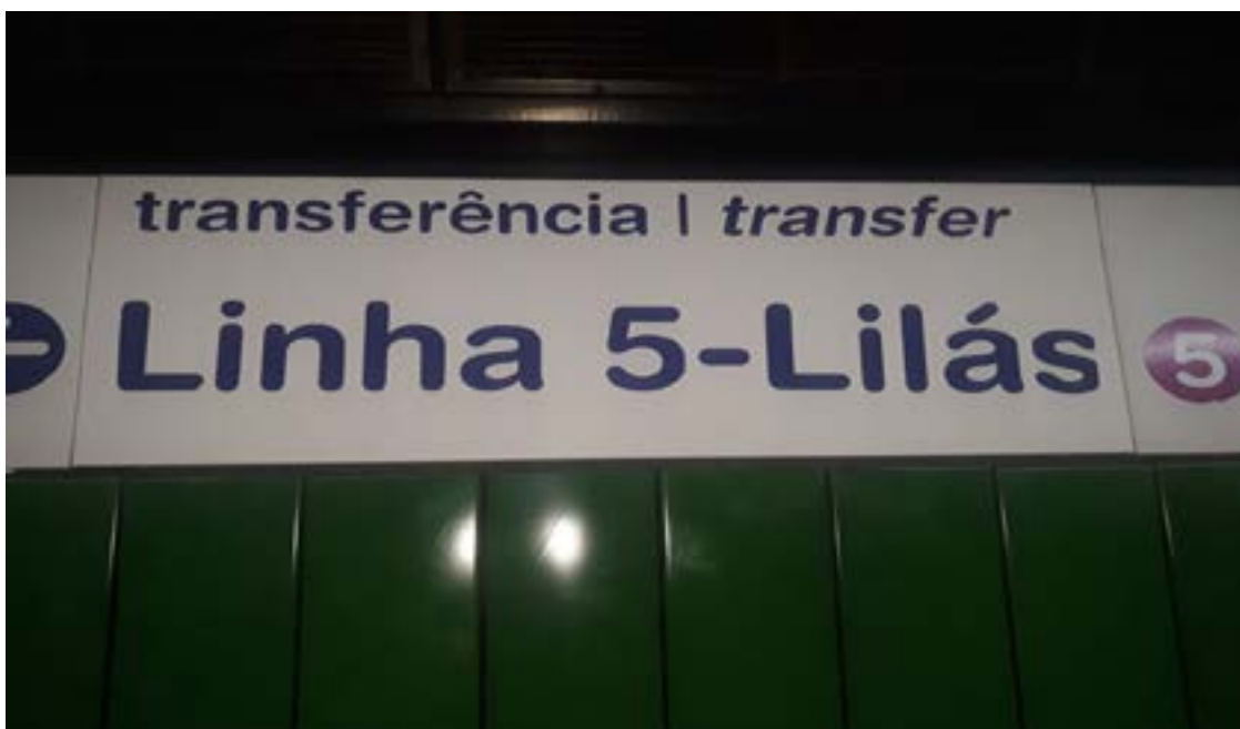
Figura 16 - Linha 5 - Lilás