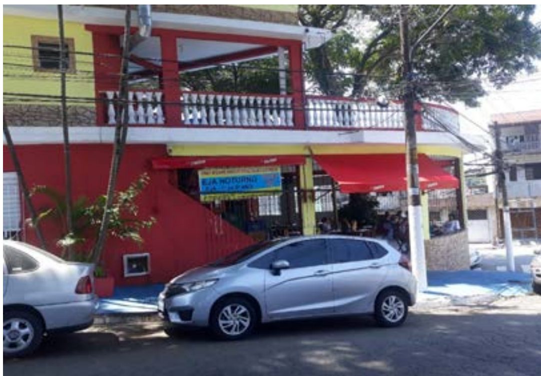
Figura 14 - Bar do Zé Batidão