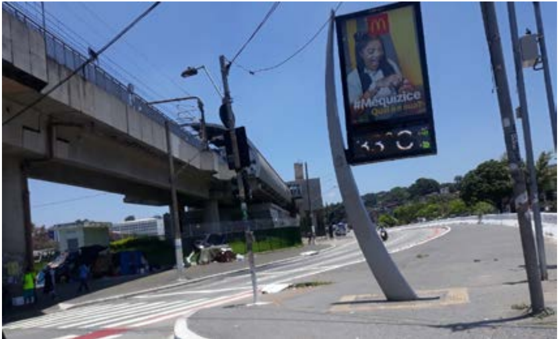
Figura 3 - Metrô do Capão Redondo