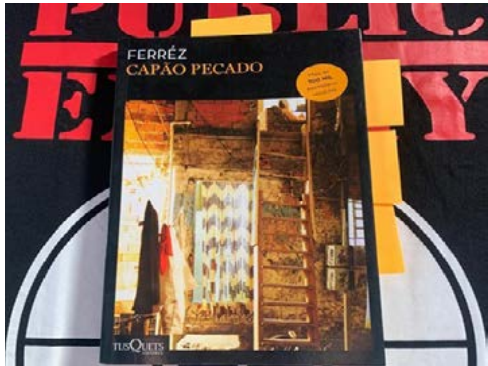
Figura 17 - Livro

“Capão Pecado”: imagens da zona sul da cidade de São Paulo – SP