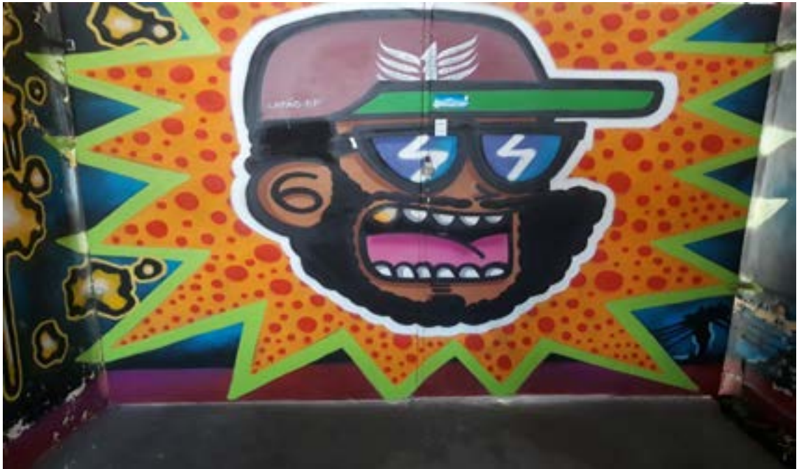
Figura 5 - Graffiti 02