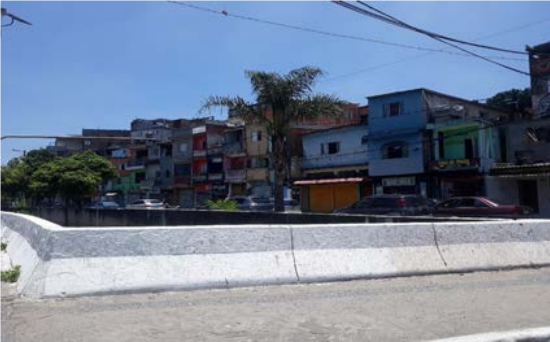
Figura 4 - Casas