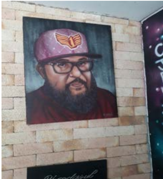
Figura 6 - Retrato do Ferréz (1DaSul)