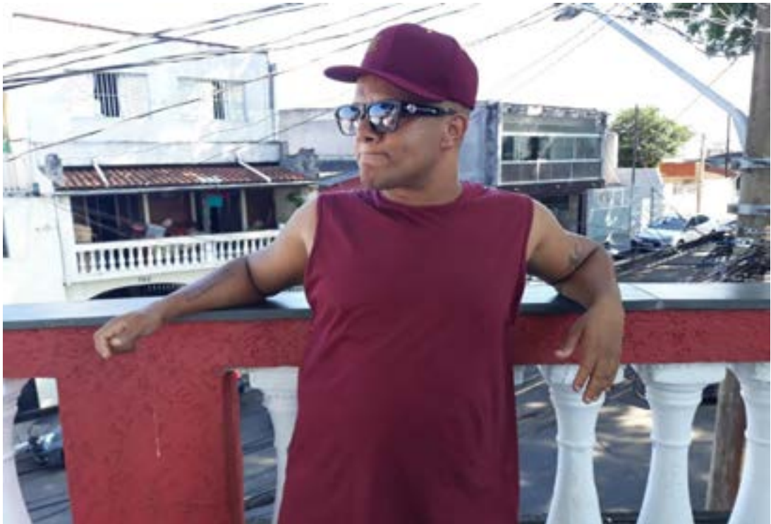
Figura 15 - Rapper Cocão a Voz