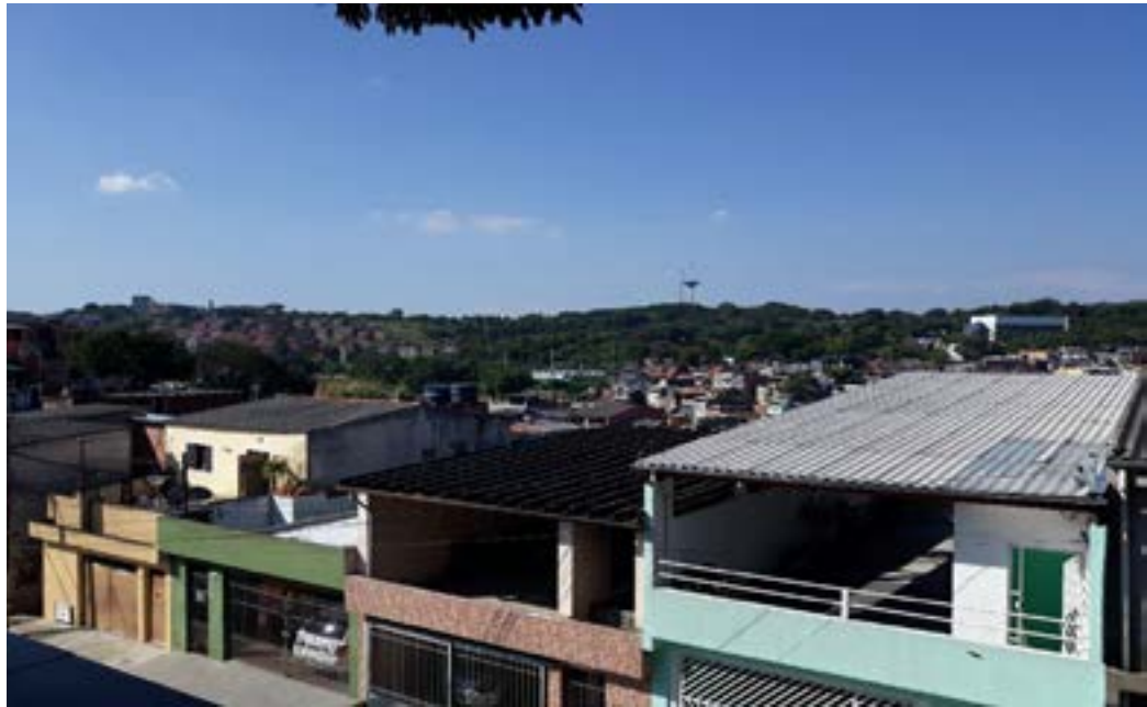
Figura 13 - Vista parcial do Jardim Guarujá