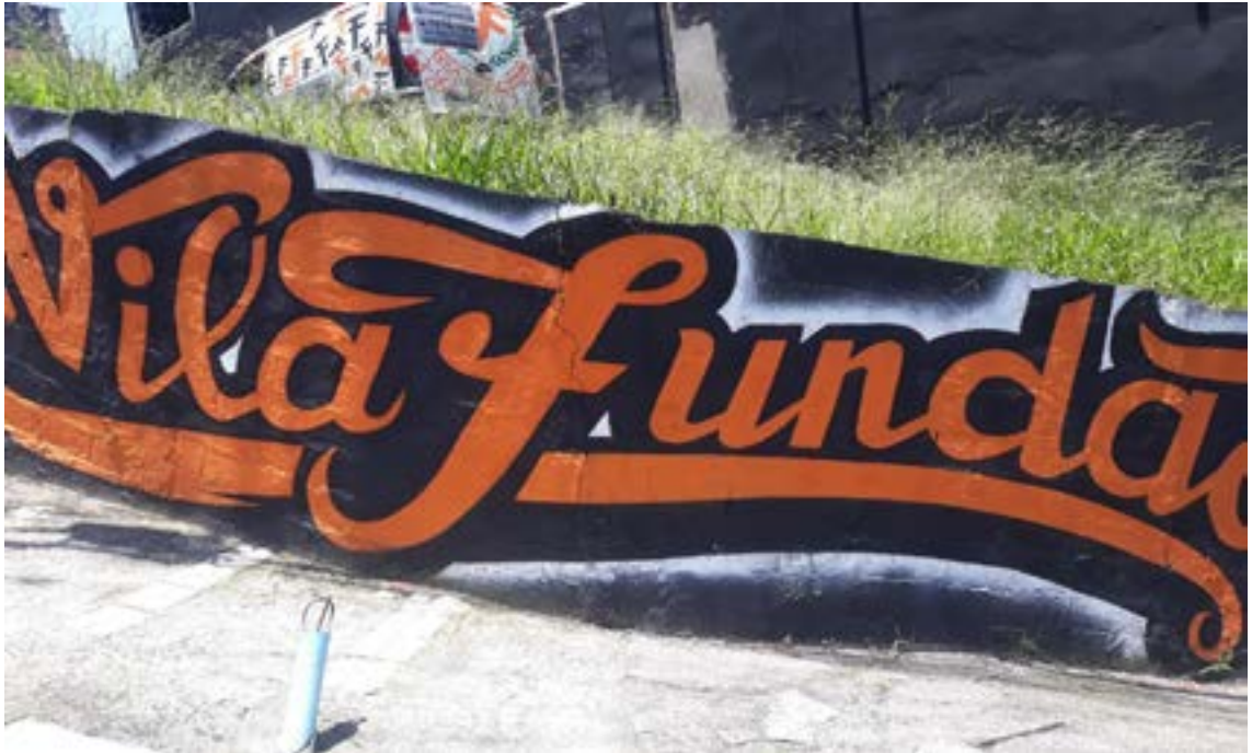
Figura 9 - Graffiti 03