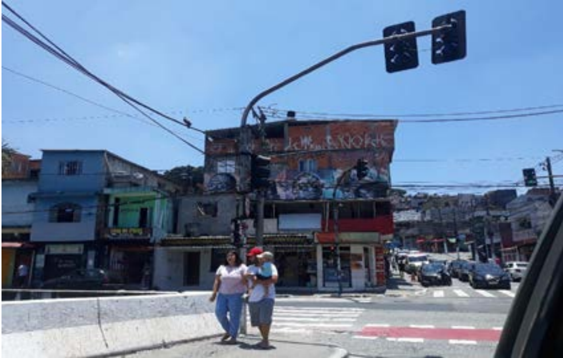
Figura 2 - Farol

“Capão Pecado”: imagens da zona sul da cidade de São Paulo – SP