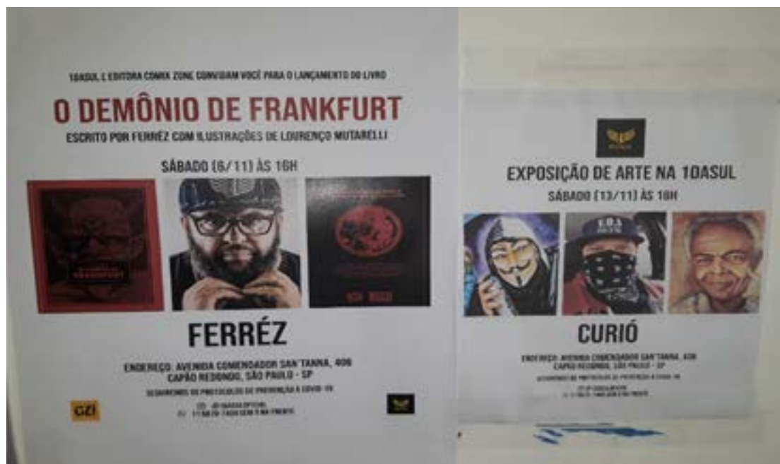
Figura 7 - Cartazes