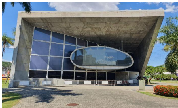
Figura 1 – Nave do Conhecimento de Madureira