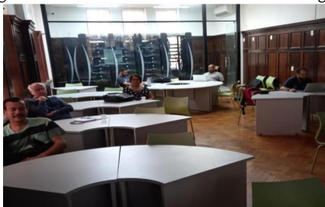
Figura 2 – Palestra na Nave do Conhecimento de Triagem