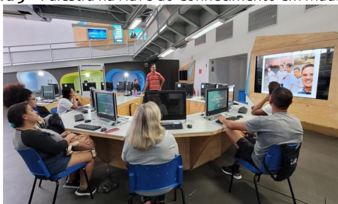
Figura 3 – Palestra na Nave do Conhecimento em Madureira