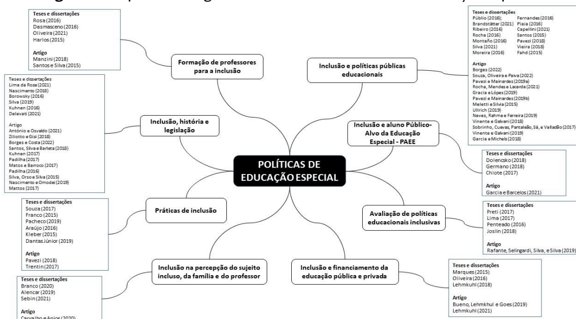
Figura 1 - Mapa das categorias temáticas de Políticas de Educação Especial

O conteúdo foi organizado em oito categorias temáticas e agrupado conforme os autores. O mapa, corresponde aos principais resultados da divisão realizada pelo investigador, conforme os autores e a categoria temática abordada.