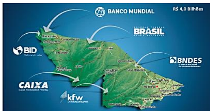
Figura 1 – Portfólio de investimento do Estado do Acre (2016-2019)

investimentos nacionais e multilaterais, como é descrito no Plano Plurianual 2016-2019, denominado Governança e Economia Sustentável (Figura 1).