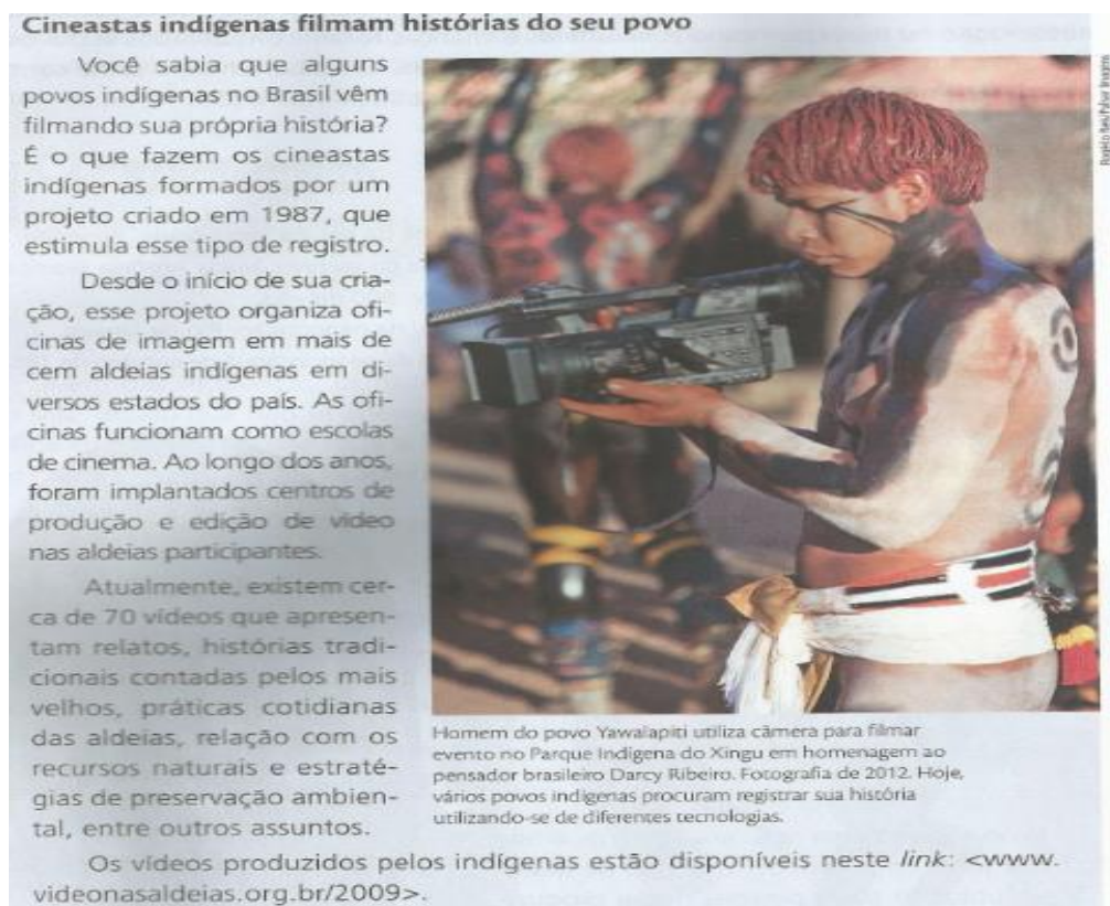
Figura 6 – Homem do povo Yawalapiti