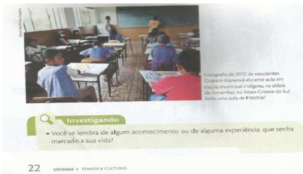
Figura 5 – Estudantes indígenas Guarani-Kaywová