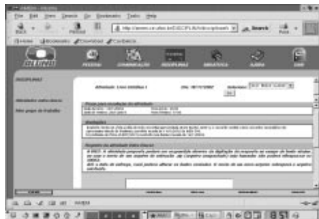
Figura 2 – Lista ds Estudantes Matriculados