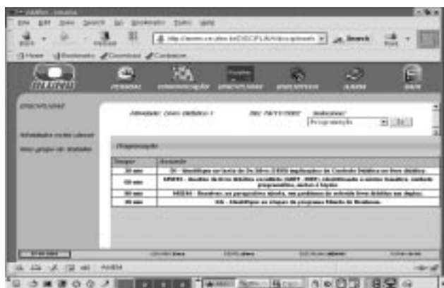
Figura 2 – Lista ds Estudantes Matriculados

Na seqüência, apresentamos a orientação para realização da TE, como explicitamos através da Figura 2. Essa tarefa sempre está relacionada aos conceitos sobre os quais dialogamos na última aula. Ela contém as diretrizes das atividades a serem efetuadas em termos da operacionalização desses conceitos pelos estudantes.