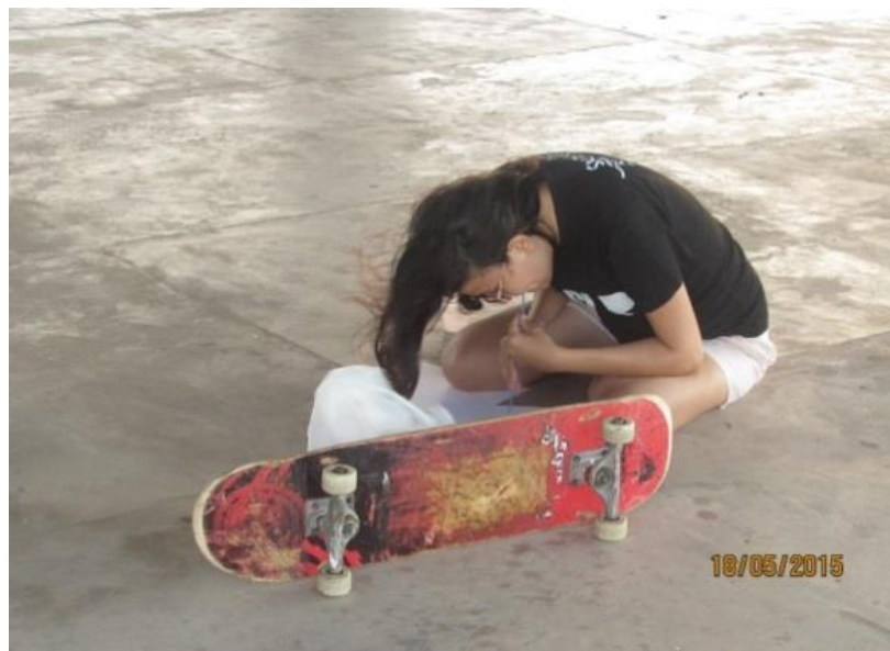
Fotografia 2 – Jovens em produção plástica do Tarô do aprender