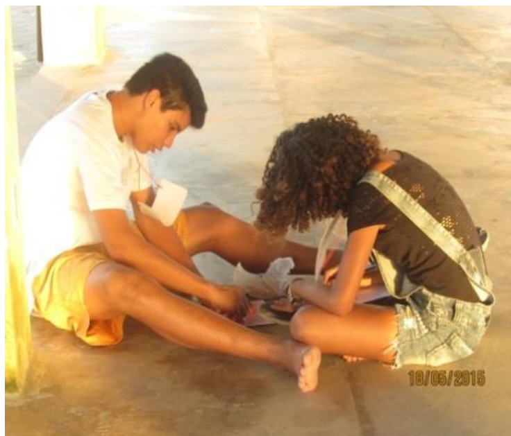
Fotografia 3 – Jovens em produção plástica do Tarô do aprender