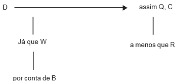
Figura 1 - Padrão de argumento (Fonte: TOULMIN, 2006).