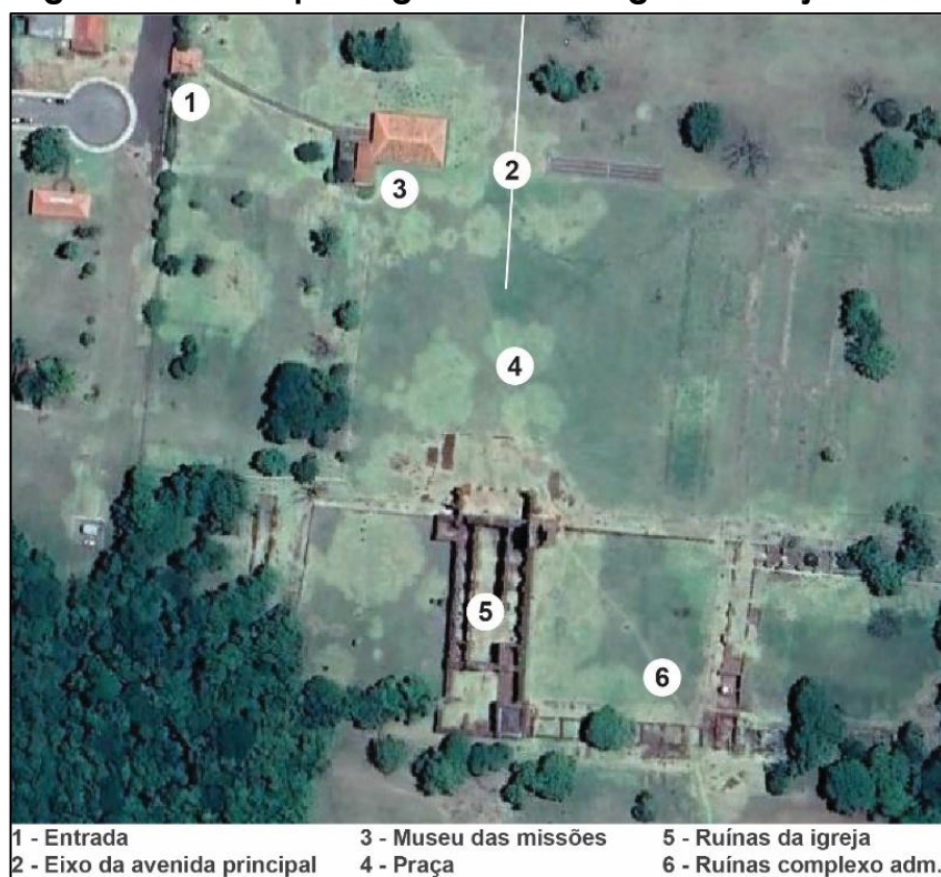
Figura 2 - Sítio arqueológico de São Miguel Arcanjo - Brasil

Fonte: organizado pelos autores (2023) 5