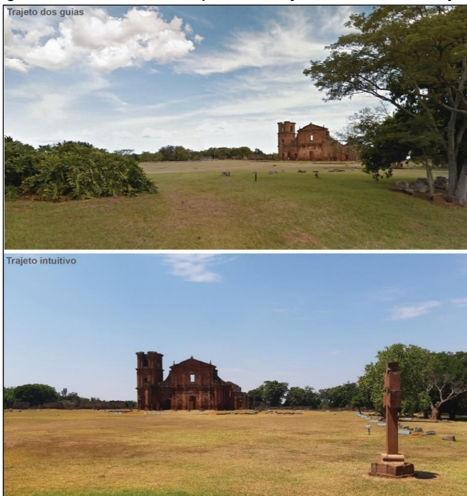
Figura 4 - Primeira visada do primeiro conjunto em ambos os trajetos

paisagisticamente. Pallasmaa (2018, p. 104) discute que “A dimensão poética da arquitetura é uma qualidade mental, e a essência artística e mental da arquitetura emerge na experiência individual da obra”, ou seja, a experiência com o espaço não é algo dado, depende, sobretudo, da maneira como o indivíduo a constrói. Dessa forma, percebe-se que o impacto paisagístico não é protagonista dessa experiência espacial (Figura 4).