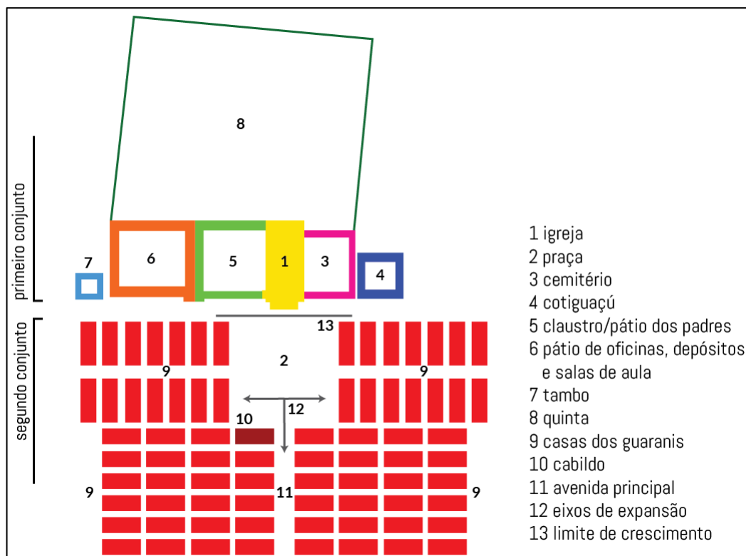
Figura 1 - Esquema de organização de uma redução jesuítico-guarani