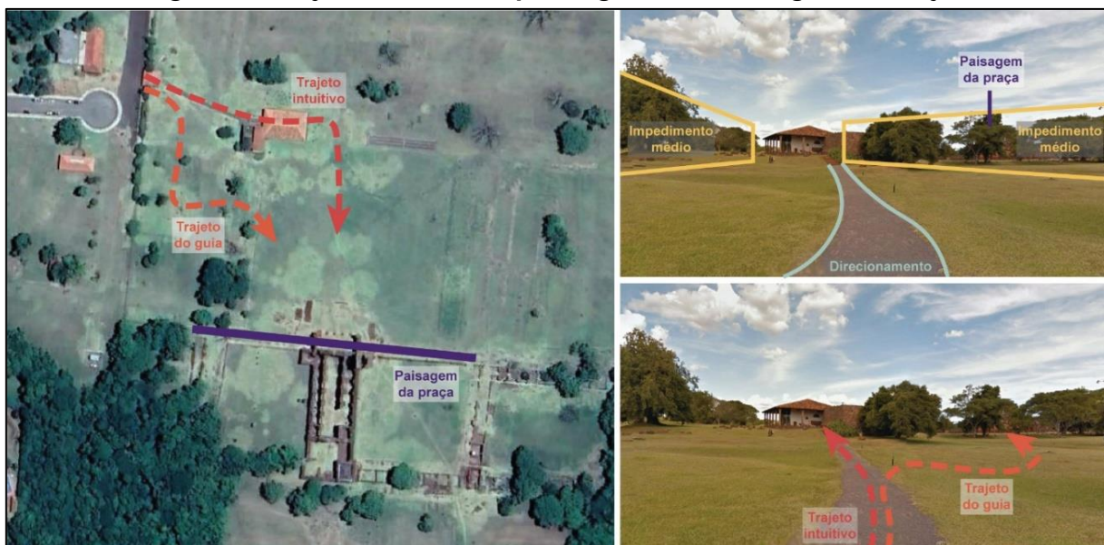
Figura 3 - Trajetos no sítio arqueológico de São Miguel Arcanjo

Antes da visitação, alguns desses aspectos sobre a composição do sítio histórico foram estudados, ou seja, já havia conhecimento prévio sobre sua organização. Quando se adentrou o espaço do sítio, a guia de turismo encaminhou para a direita, antes de passar pelo museu, a fim de entrar na praça por sua aresta lateral (Figura 3).