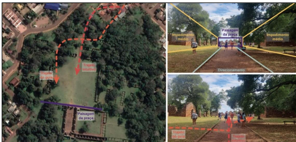
Figura 6 - Trajetos no sítio arqueológico de San Ignacio Miní - Argentina