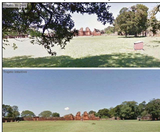
Figura 7 - Primeira visada do primeiro conjunto em ambos os trajetos

Novamente, ao percorrer a avenida, a surpresa pela mudança no trajeto da visita, quando o guia se deslocou da avenida em direção às ruas laterais (Figura 6). O guia de turismo explicou aspectos da tectônica das residências e da organização espacial, informações relevantes para o entendimento histórico da redução. Porém, ao fim da explicação, não se retornou à avenida. Em vez disso, o grupo foi direcionado a adentrar a praça pela aresta lateral direita, modificando novamente a escala de apreensão do espaço (Figura 7).