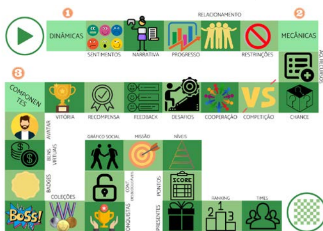
Figura 2 - Modelo de Gamificação de Werbach e Hunter (2012) em forma de tabuleiro.

Fonte: Werbach e Hunter (2012); Organização: Pedro Victor Matos Lopes (2022).