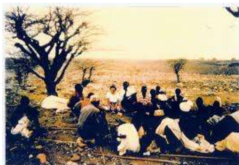
Fig. 6: Círculo de Cultura.

A consciência emerge do mundo vivido, objetiva-o, problematiza-o, compreende-o como projeto humano. Em diálogo circular, intersubjetivando-se mais e mais, vai assumindo, criticamente, o dinamismo de sua subjetividade criadora. Todos juntos, em círculo, e em colaboração, reelaboram o mundo e, ao reconstituí-lo, apercebem-se de que, embora construído também por eles, esse mundo não é verdadeiramente para eles (FREIRE, 2017, p. 24).