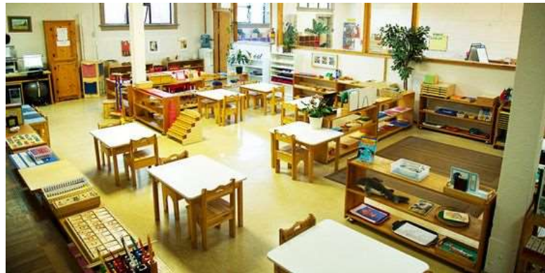
Fig. 3: Exemplo de uma sala de aula de uma escola montessoriana contemporânea.

Como pôde ser visto a partir dos elementos acima, o ambiente escolar para Montessori é o local onde a criança desenvolve sua autonomia e compreende sua liberdade. Para ela, um ambiente organizado e atraente significa que foi construído para a criança, atendendo às suas necessidades biológicas e psicológicas. Nos ambientes preparados para o método montessoriano, encontram-se mobília de tamanho adequado e materiais de desenvolvimento preestabelecidos para a livre utilização da criança (Fig. 3). 7