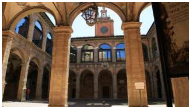
Fig. 2: Pátio interno da Universidade de Bolonha, Itália.

Com a queda do Império Romano, convencionou-se o início da Idade Média. Nesse período, no Ocidente, o monopólio da educação volta para o domínio das religiões, marcadamente para a Igreja Católica. Os processos de ensino e aprendizagem formais ficam restritos aos monastérios e abadias, aos seus membros, seguindo as normas da Igreja. Basicamente, se limitam à leitura individual e ao trabalho dos copistas. O conhecimento se torna protegido e enclausurado. Porém, é nessa mesma época que surge a primeira universidade da Europa, a Universidade de Bolonha (fig. 2), em 1088, na Itália (a primeira a usar esse termo). Em seguida, são instituídas as Universidades de Oxford (1096) e de Paris (1170) 5 .