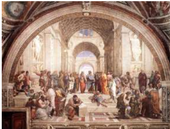
Fig. 1: "A Escola de Atenas" é um afresco de Rafael (1506-1510) que está na Stanza della Segnatura, no Vaticano, em que são retratados vários filósofos gregos. Ao centro, Aristóteles caminha ao lado de Platão.

frase “Conhece-te a ti mesmo e conhecerás os deuses e o universo” escrita no pátio do Templo de Apolo em Delfos.