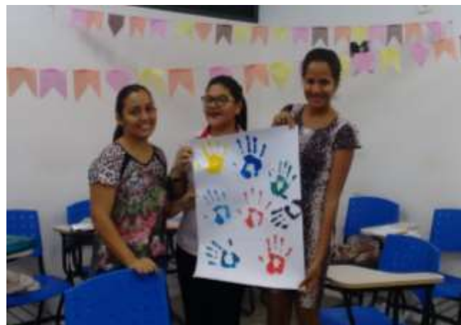
Figura 8 – Apresentação de seminário do eixo de artes visuais. Fonte: Autora, 2016. Fonte: Autora, 2016.

Através das imagens podemos observar que os objetivos propostos para os seminários foram atingidos, uma vez que todos os grupos interagiram com a turma proporcionando um espaço de aprendizagem diferente e diversificado, pois, através das atividades que cada grupo de seminário desenvolvia com a turma, os alunos se mostravam mais participativos e com prazer em participar da aula.