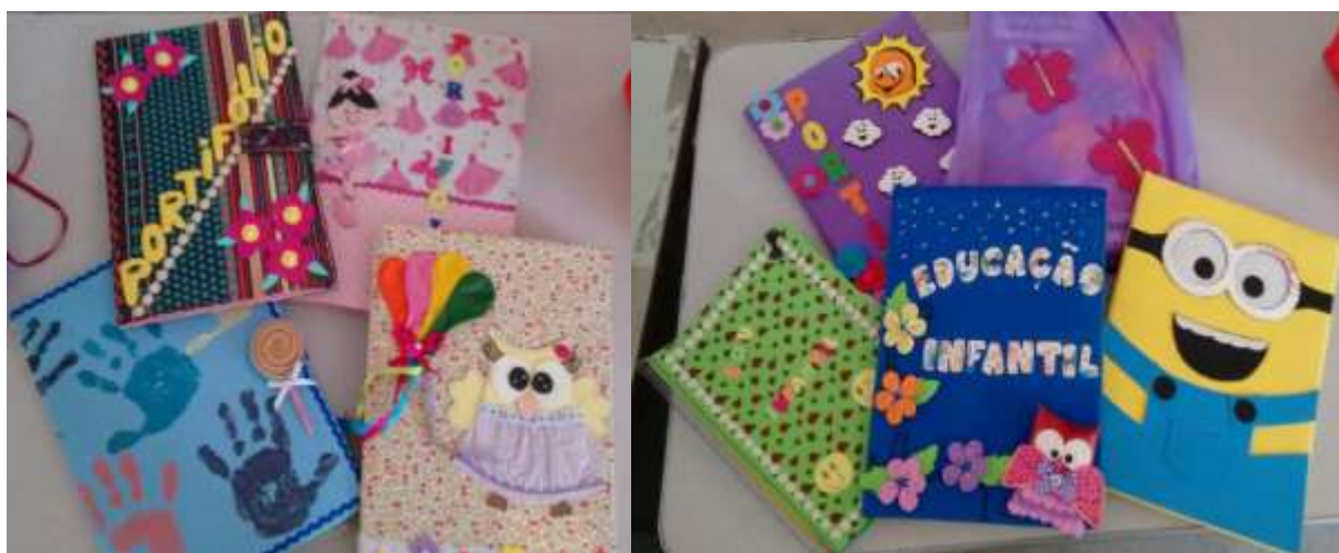
Figura 9 - Portfólios construídos pelos alunos.

Portanto, compreendemos que o uso do Portfólio como atividade avaliativa vai além de uma coleção de produções, é uma estratégia de ensino que propicia processos de aprendizagens significativos, estimulando de forma expressiva à criatividade dos discentes (FIG. 9).