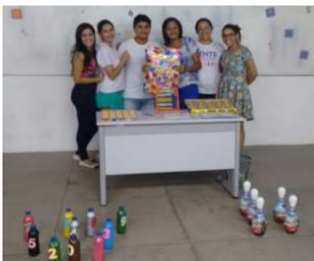
Figura 5 – Apresentação de seminário do eixo de matemática.

compreensão das temáticas em questão com os demais alunos. E, o professor pode interagir com a sala, contribuindo para apresentação e para a aprendizagem dos mesmos, podemos verificar nas figuras seguintes. (FIG. 5,6,7 e 8).