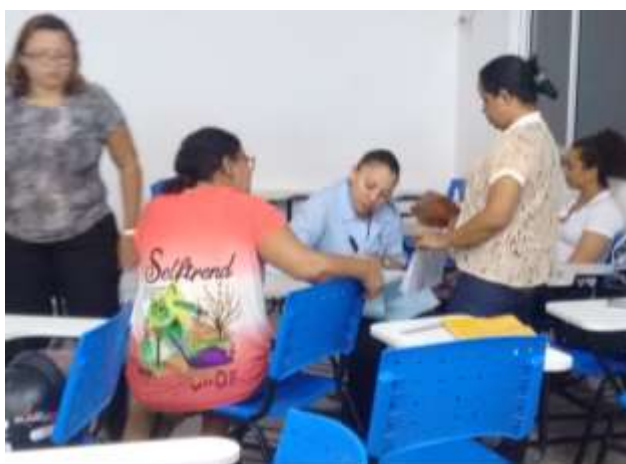
Figura 3 – Construção coletiva da linha do tempo dos novos tópicos na história da Educação Infantil no Brasil.