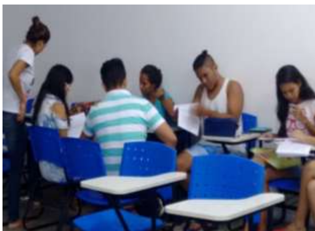
Figura 1 – Construção coletiva da linha do tempo dos primeiros passos da história da Educação Infantil no Brasil.

Entendemos que ao desenvolvermos uma atividade onde alunos e professores estejam trabalhando em conjunto, teremos um ambiente onde a aula permitirá trocas de saberes entre os colegas sendo um fator altamente favorável à melhoria da aprendizagem, conforme nos mostra as figuras (FIG. 1, 2, 3 e 4).