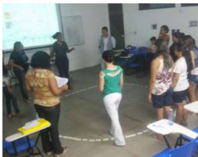
Figura 6 – Apresentação de seminário do eixo de música.