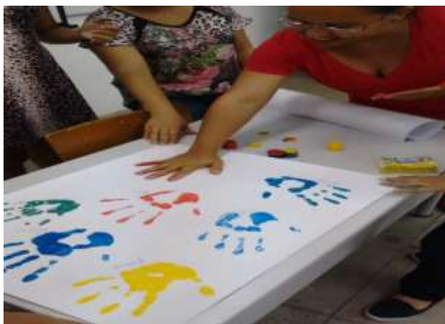
Figura 7 – Apresentação de seminário do eixo de artes visuais.