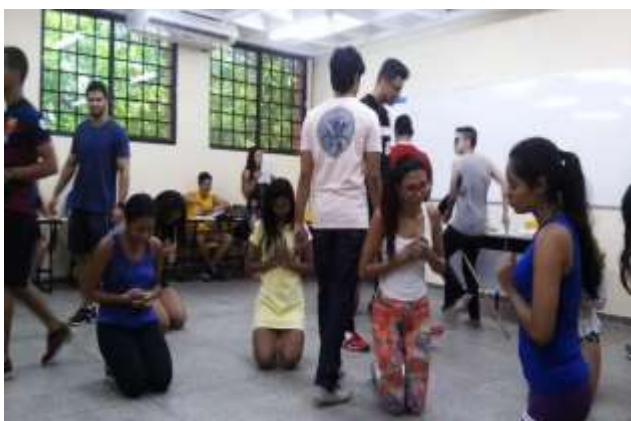
Figura 2 – Dramatização do Poema “Morte e Vida Severina”.

poema de João Cabral de Melo Neto, Morte e Vida Severina. A proposta foi articular os conteúdos vistos na teoria, com a prática proporcionada pela interação dos alunos com a música e o poema. Desde modo, a turma foi dividida em dois grupos, onde, um ficou com a música, desenvolvendo uma coreografia e o outro com o poema, trabalhando-o por meio da dramatização. Na figura 2 e 3, apresentamos as atividades desenvolvidas pelos dois grupos.