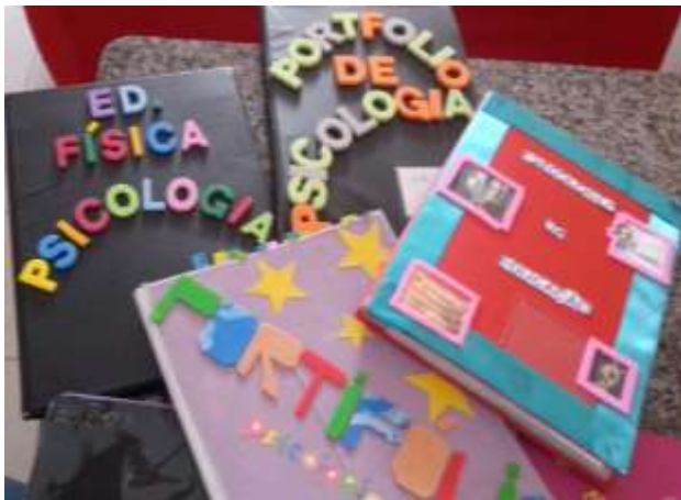
Figura 5 – Alguns portfólios confeccionados pelos alunos.

E nessa perspectiva, os alunos, entregaram os portfólios, abordando com muita criatividade as, atividades desenvolvidas, os registros de trabalhos, seminários, inserindo suas reflexões sobre o que aprenderam na disciplina, como mostram as Figuras 5 e 6.