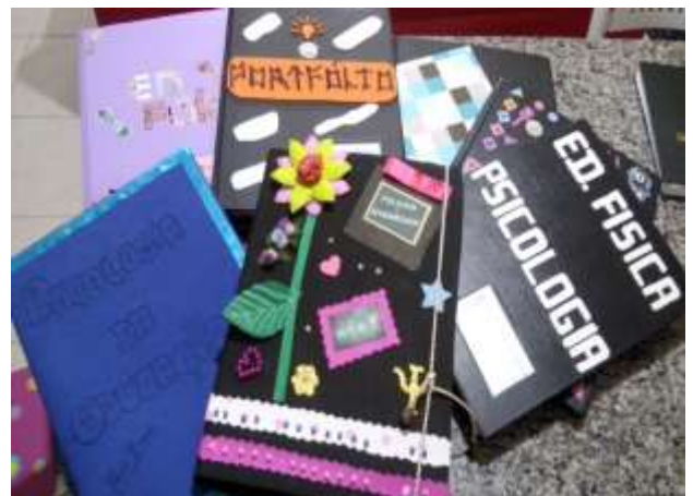
Figura 6 – Portfólios confeccionados pelos alunos da turma.

Nesse sentido, concordamos com Vilas Boas (2001), ao utilizar o portfólio como um importante instrumento de avaliação, que reúne as produções dos alunos e professores desenvolvidas em determinado tempo, para que, eles próprios reconheçam seus esforços, seus progressos e suas necessidades nas diversas áreas do conhecimento.