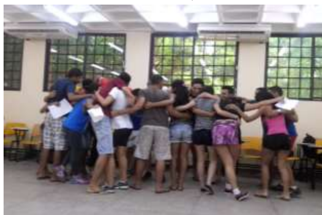
Figura 3 – Alunos desenvolvendo uma coreografia da música “Metamorfose Ambulante”.