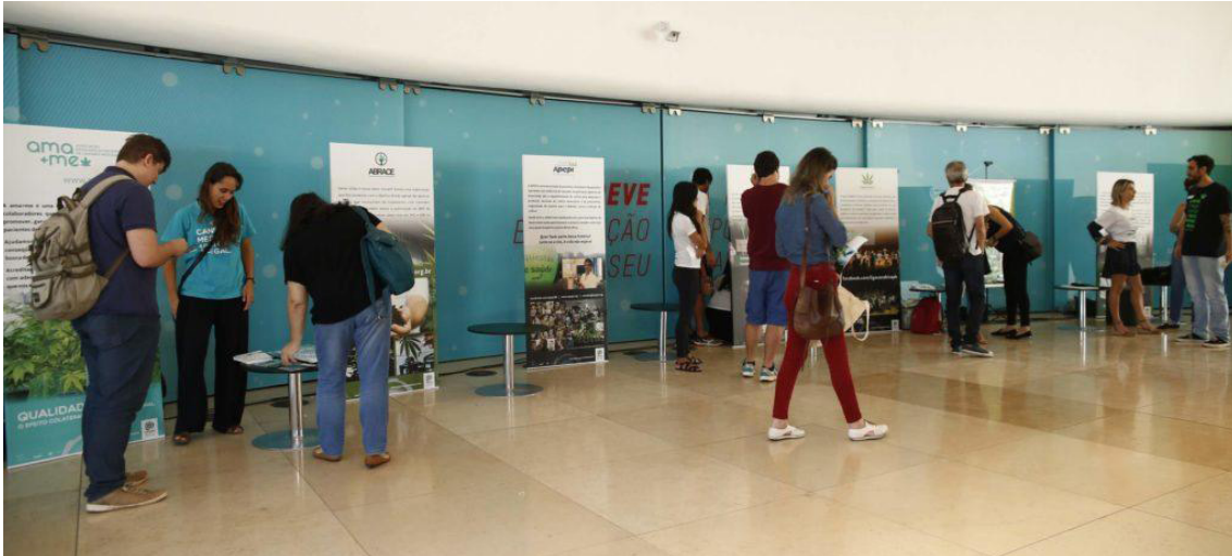
Banners das associações no hall de entrada do auditório. I Seminário Internacional “Cannabis Medicinal: um olhar para o futuro”.