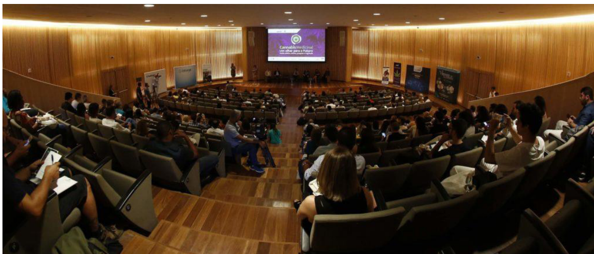
Auditório do Museu do Amanhã durante o seminário “Cannabis Medicinal: um olhar para o futuro”. 18/05/2018.