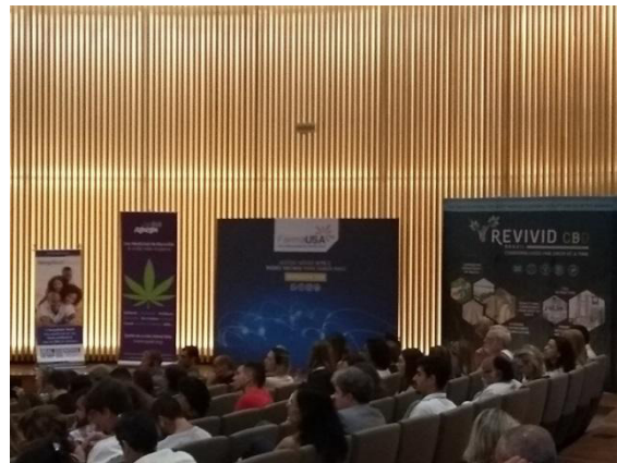
Banners das empresas dentro do auditório, outra contrapartida do patrocínio. I Seminário Internacional “Cannabis Medicinal: um olhar para o futuro”.