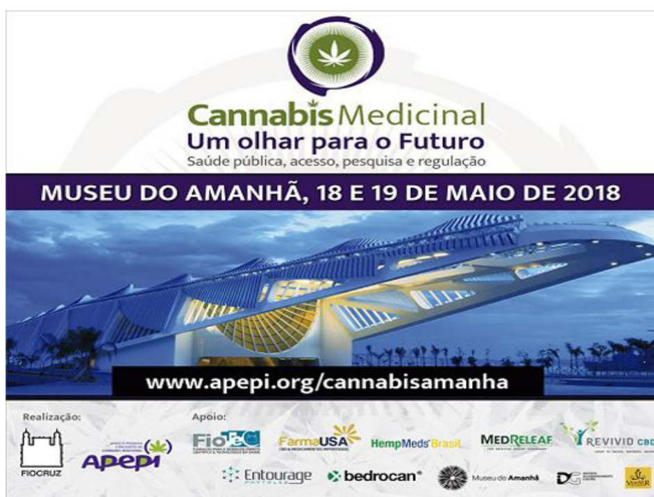
Arte de divulgação do Seminário “Cannabis medicinal: um olhar para o futuro”.