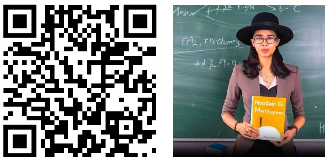
Figura 2: QR CODE do vídeo-áudio produzido e foto do vídeo

https://studio.d-id.com/share?id=eb9d50ecc41f11c8dc0a6871f820f2f9&utm_source=copy