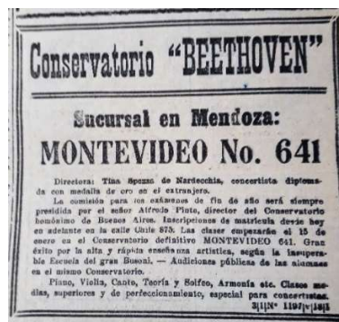
Figura 3: Aviso Conservatorio Beethoven