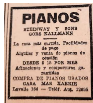
Figura 2: Casa Max Xarrié