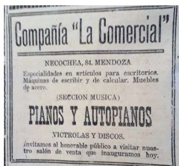
Figura 1: Aviso La Comercial