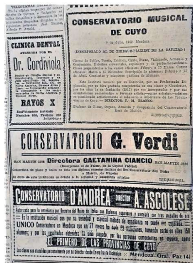
Figura N° 4: Avisos de 3 Conservatorios