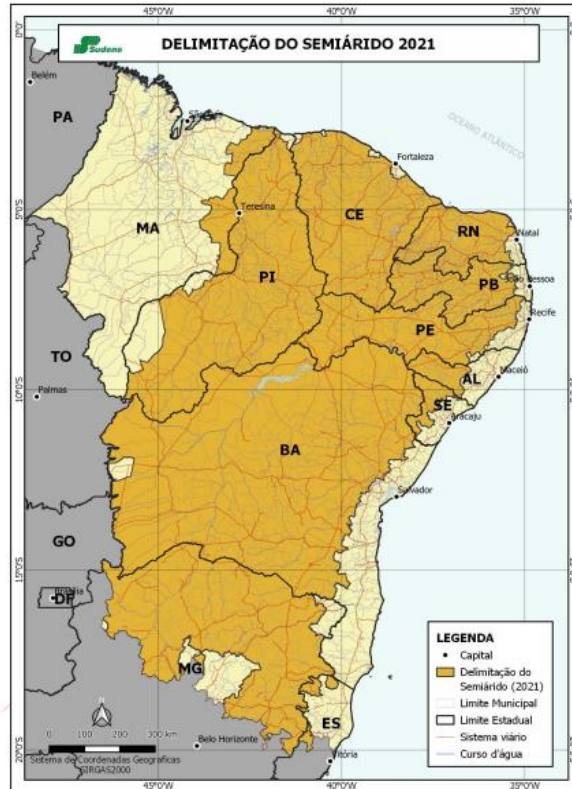
Figura 1. Representação do Semiárido Brasileiro.

O Semiárido Brasileiro (Figura 1) é o maior do mundo em extensão, com sua área de aproximadamente 900.000 km 2 , abrangendo os estados do Piauí, Rio Grande do Norte, Bahia, Alagoas, Sergipe, Ceará, parte do Maranhão e o norte de Minas Gerais (Farias; Marquesan, 2016).